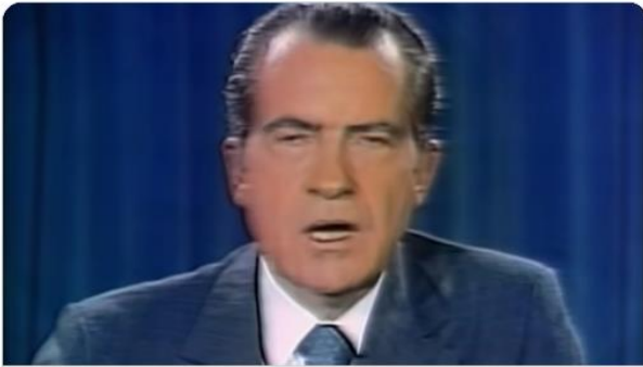
Gold & Dollar: How Money Became Worthless | Currencies Explained [...] Documentary on World Currencies, Dollars, Gold and Money: End Of The Road: How Money Became Worthless - Wall Street is being occupied. ... youtube.com

zelf kwalificeren als complottheorie. Echter, inmiddels weten wij dat veel fake news, niet fake is. En dat veel zaken die worden gebracht als waarheid, slechts meningen en geen feiten zijn. Het lijkt erop dat de wereld van Fake Capitalism gaat wijzigen naar Fake Stakeholder Capitalism. Maar daar laten wij u graag zelf over oordelen.